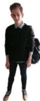
SWEATER WEATHER Jõnu 12.D