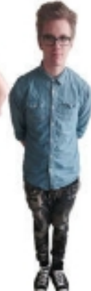
DETAILED DETAILS Martin 12.D