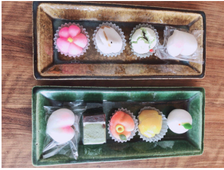
Anni kodukoha maiustused