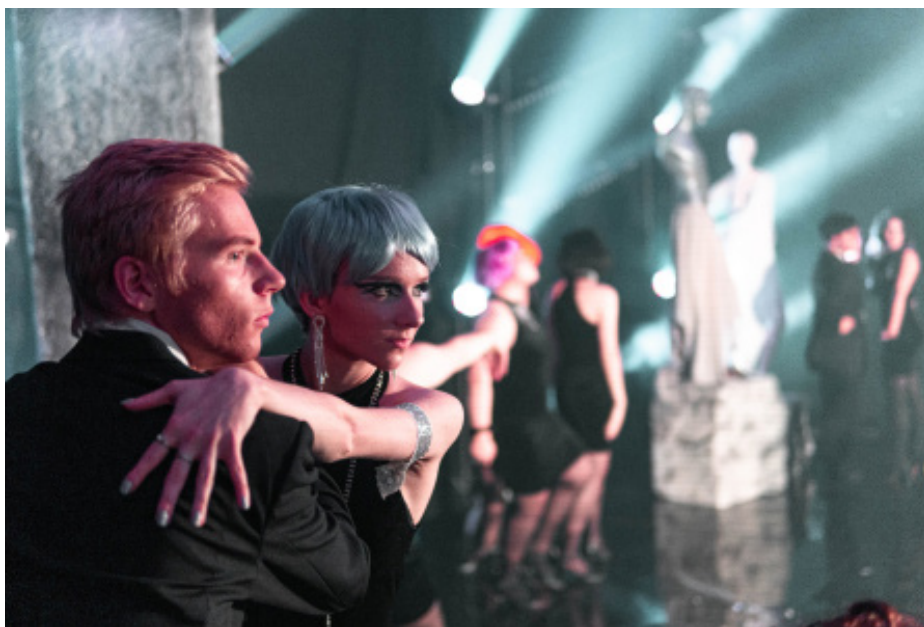
11.d esituses „The Rich Man’s Frug” filmist „Sweet Charity” 11.c

Esimesena näitas laval säärejooksu 9.b, mille liikmed olid laval punaste hommikumantlite, võrksukkade ja tamburiinidega. 10.c esituse ajal sai näha laval ka nende klassijuhatajat, kes oli küll peidus hiiglasliku pea taga. 10.c tundus unustavat, et nad on multimeediaklass, mitte tantsu oma ja tõi lavale vägevad liigutused ja omavahel sobivad pused, mis teenisid neile ka teise koha! 9.a läks kohe Bollywoodi radadele ja tõi lavale numbri „Gori Gori”, mille kohta said õhtujuhid küsides teada, et see tähendab „kallis kallis”. Kalliks osutus neile ka võidetud Bollywoodi eripreemia.