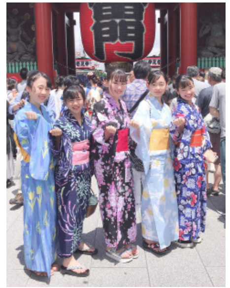
Ann koos sõpradega

Ma elan Yokohama linnas, see on Tokyost 30 km kaugusel.