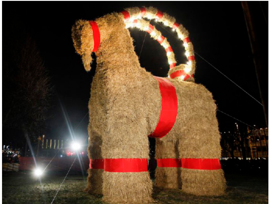
Gävle jõulusokk

Kellele ei meeldi sokud? Rootslastele, isegi kui nad neid igal aastal jõuludeks ehitavad. Gävle jõulusokk on üles pandud iga aasta esimesel adventil, kuid on kahjuks loetud päevadega saanud