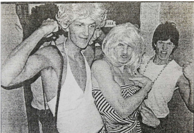
Playbox 2007