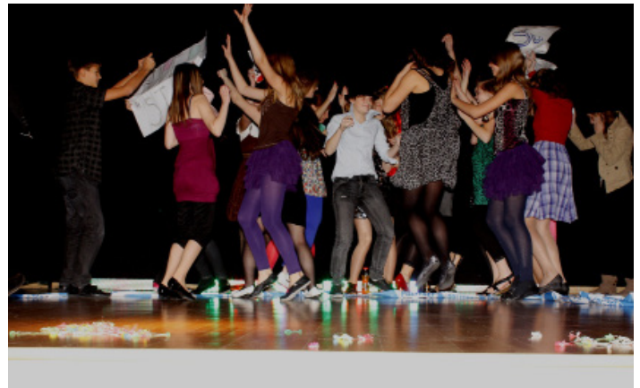
Playbox 2010