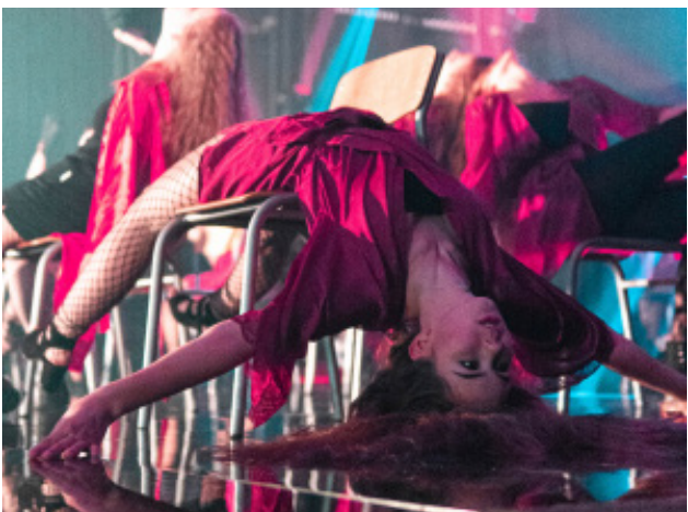
Playbox 2019