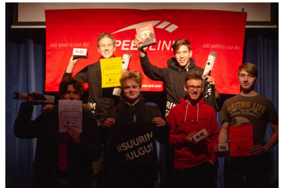
CS:GO võitjad

Kõik kolm on mitu aastat mänginud CS:GO-d. Pole asju, mida nad ei teaks selle mängu kohta. Tänu oma arvukatele teadmistele lahendati ka kõik tehnilised viperdused. Ainuke suurem probleem oli virtuaalreaalsuse seadmega rallivõistlus, nimelt läks tarkvara allalaadimisele kaheksa tundi. Lisaks sellele selgus hiljem, et plaanitud mängud ei toimunud hästi. Kuna mängud ja tarkvara allalaadimine ei toimunud, jäid planeeritud ajasõidud mängudes „DiRT Rally” ja „Assetto Corsa” ära.