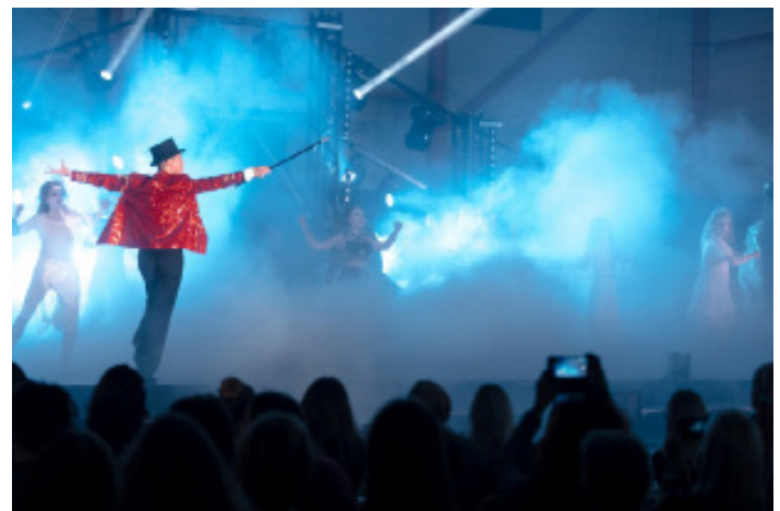
Playbox 2018