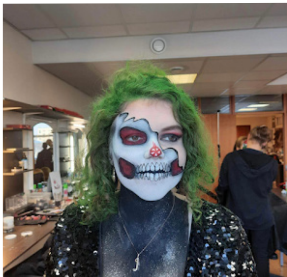
Anete tehtud make-up