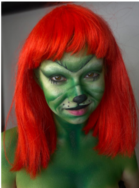
Anete tehtud make-up