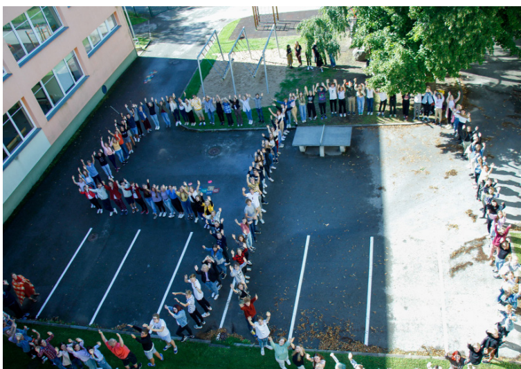
Pildil: 50. lend

naerata ja elu naeratabki vastu suurte kirevate tulpide sisemuses õhtusinases loojangus hommikus kohvis naeratab sulle tee ääres tatsavas siilionus ja linnukeses akna taga läbi väikeste väärtuslike ja väledate hetkede